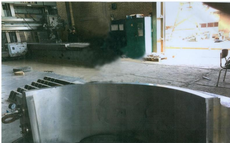
یاتاقان به وزن ۵ تن بایست شده هنگام تست فشار کانال آب و روغن شرکت سیمان سفید نی ریز

یاتاقان ۵ تنی بایست شده هنگام تست فشار کانال آب و کانال روغن شرکت سیمان نی ریز