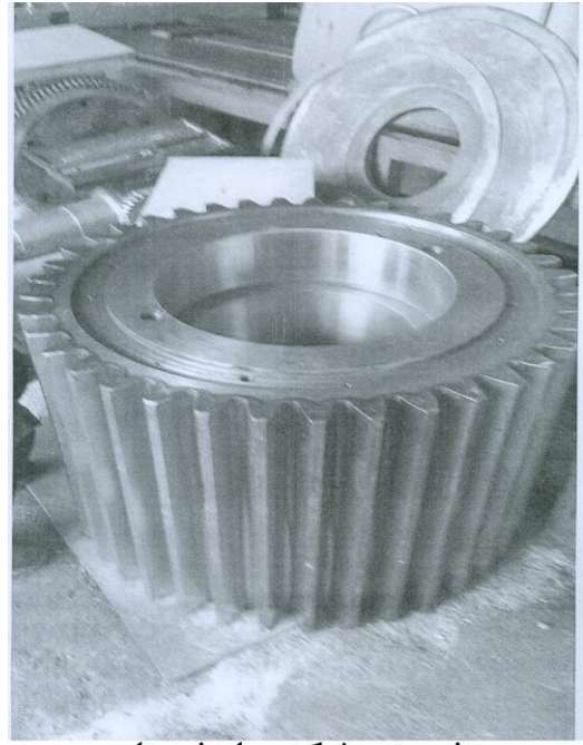
دنده پینیون شرکت سیمان خوزستان به قطر ۱۰۰۰ میلی متر و ارتفاع ۹۰۰ میلی متر