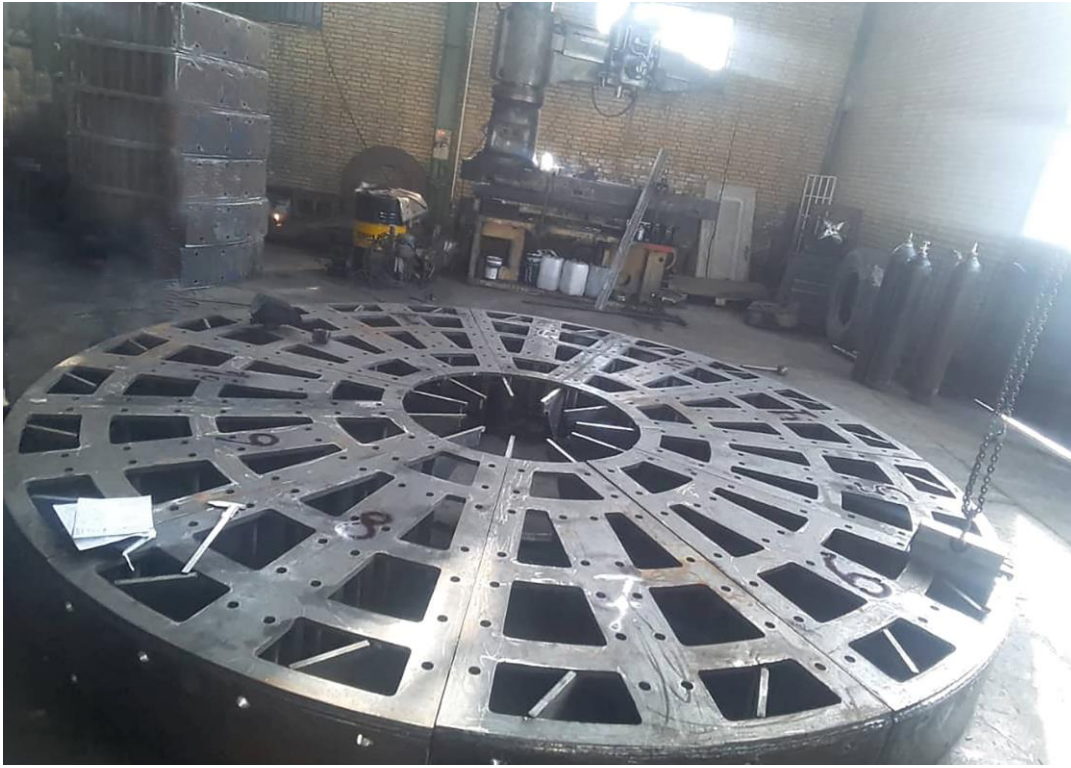
شاسی دیافراگم وسط آسیاب به قطر ۴۳۶۰ میلیمتر شرکت سیمان خاش