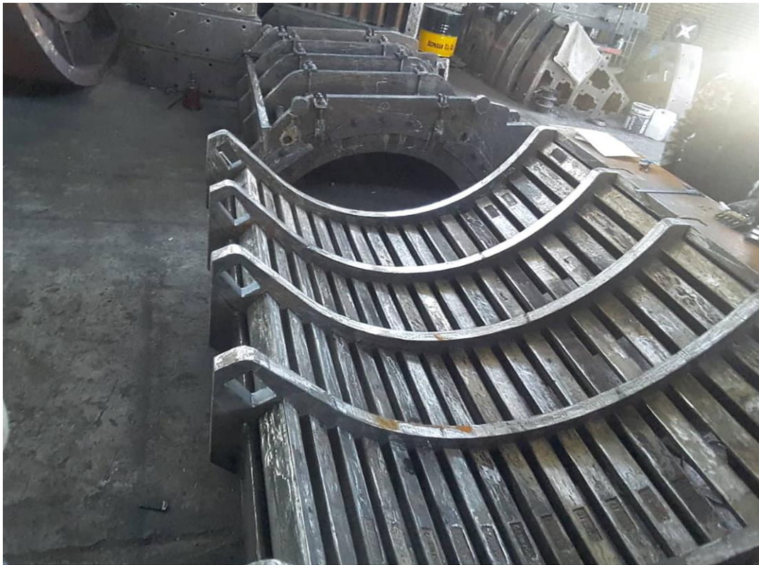
گریت بسکت سنگ شکن اهک شرکت سیمان خاش