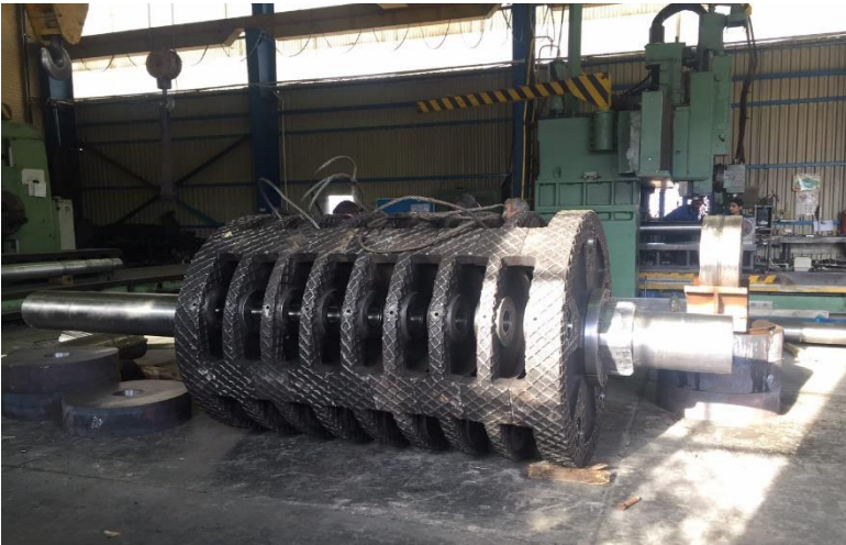
روتور سنگ شکن آهک به وزن ۲۰ تن شرکت سیمان خاش