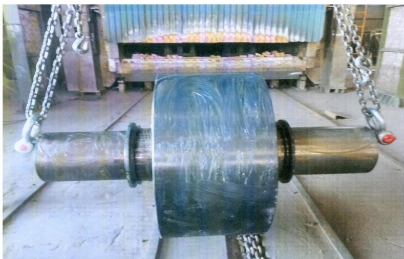
شافت و غلطک شرکت سیمان فارس به وزن تقریبی ۱۰ تن

غلطک کولر سیمان سفید نی ریز به وزن ۵.۵ تن وضخامت جداره ۱۲۰ میلی متر