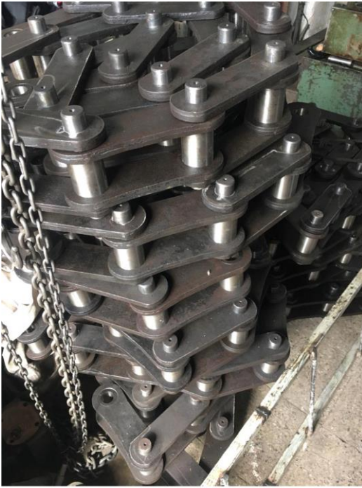
زنجیر الواتور شرکت سیمان فارس نو