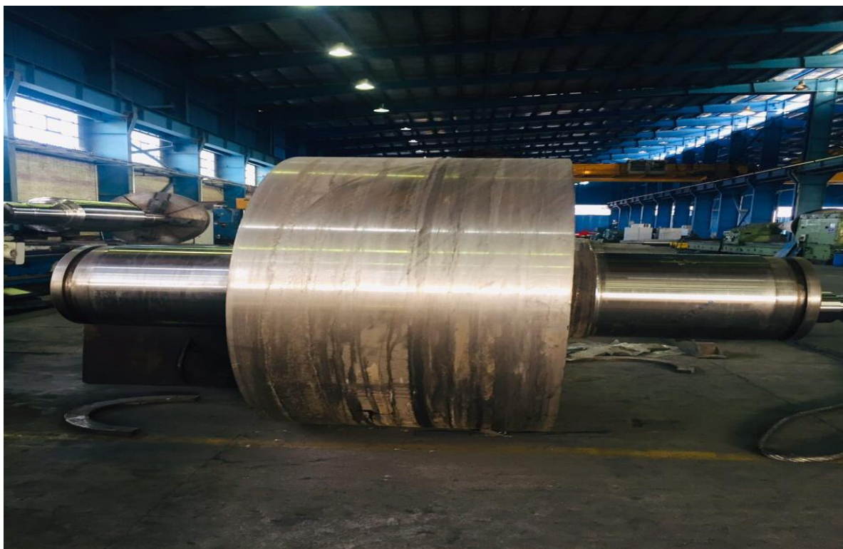
شافت و غلطک کوره سیمان خوزستان به قطر ۲ متر

در این خصوص شرکت فنی مهندسی نیما اصفهان متشکل از کارشناسان متعهد و متخصص با سالها تجربه در صنایع کشور خدمات خود شامل بازرسی فنی، مهندسی معکوس و مشاوره فنی در راستای توسعه صنایع را اریه می نماید.