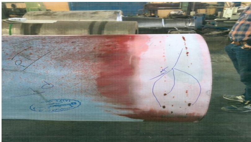
Reject شافت تعمیر شرکت سیمان خاش

عدم تایید (Reject) شافت تعمیری شرکت سیمان خاش