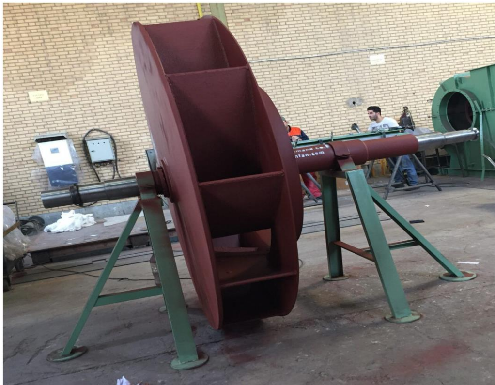
روتور IDfan شرکت سیمان خوزستان به قطر ۳.۴ متر